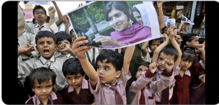
Figura 1. Malala Yousafzai